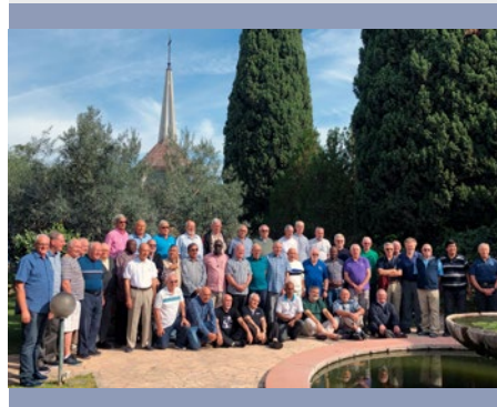
CASA GENERAL: ENCUENTRO DE LOS TRES GRUPOS QUE PARTICIPAN EN EL PROGRAMA DE FORMACIÓN AMANECER