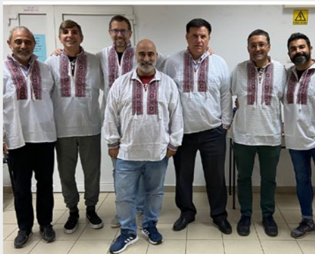
RUMANÍA: REUNIÓN DEL CONSEJO PROVINCIAL DE IBÉRICA