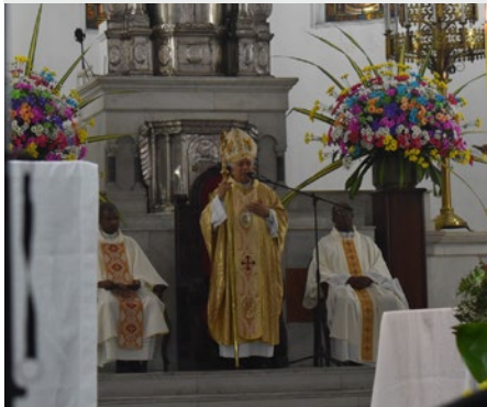
COLOMBIA: CELEBRACIÓN DE LOS 125 AÑOS DE LA FUNDACIÓN DEL COLEGIO DE SAN LUIS GONZAGA, EN CALI