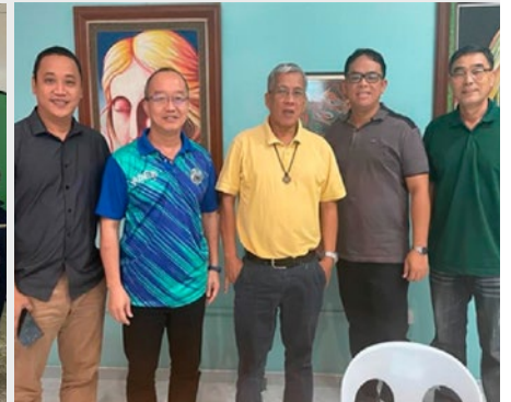
FILIPINAS: CONSEJO PROVINCIAL DE EAST ASIA