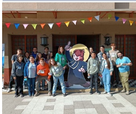
CHILE: ENCUENTRO NACIONAL DEL MOVIMIENTO MARCHA EN EL COLEGIO DIEGO ECHEVERRÍA DE QUILLOTA