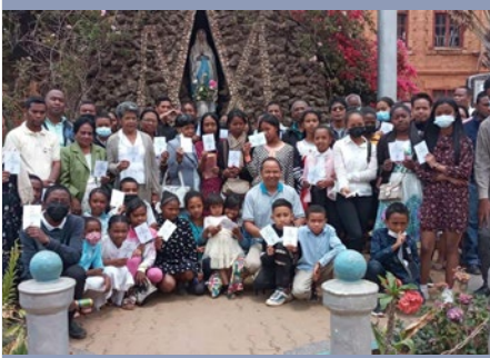
MADAGASCAR: CELEBRACIÓN DEL AÑO VOCACIONAL MARISTA EN ANTSIRABE