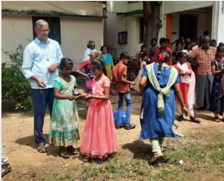
INDIA: MARCELLIN TRUST – RAINBOW