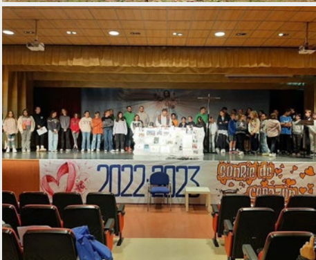
ESPAÑA: JÓVENES DE GRUPOS MARCHA SJP