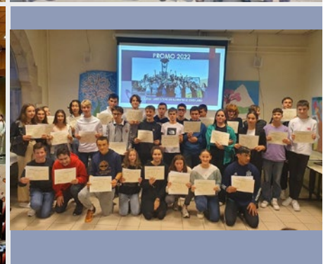
FRANCIA: COLLÈGE SAINT LOUIS, ENTREGA DE DIPLOMAS

A través de la oración y la contemplación de la realidad y, sobre todo, el poder compartir cotidianamente con los demás miembros de la comunidad, he podido dar otro significado a mis objetivos y comprensión de lo que significa ser misionero marista. Ahora veo que aquellos con quienes viví no son destinatarios de mi apostolado, al contrario, son el camino y la verdad, porque contribuyen activamente en mi proceso de autoconocimiento, aceptación y crecimiento personal. Poco a poco, he comprendido que el gran aporte que puedo dar en este espacio no es traer algo nuevo o inédito, sino simplemente estar juntos, compartir lo que puedo y, sobre todo, aprender. Esta es una verdad simple y poderosa.