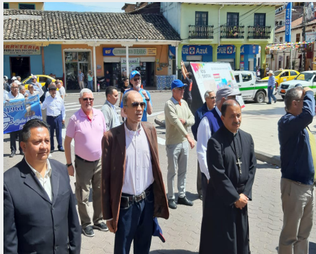
ECUADOR: CELEBRACIÓN DE LOS 65 AÑOS DE PRESENCIA MARISTA