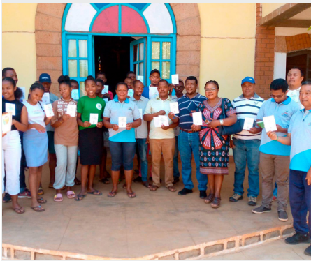
MADAGASCAR: CELEBRACIÓN DEL AÑO DE LAS VOCACIONES EN IHOSY