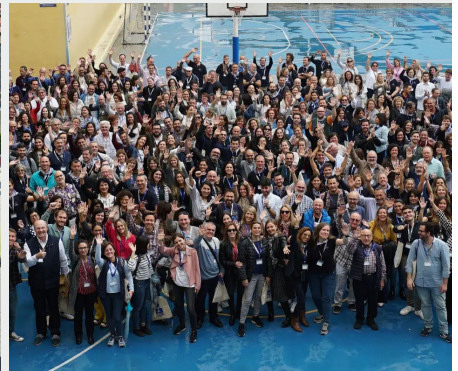
ESPAÑA: IV JORNADAS DEL EDUCADOR MARISTA EN VALENCIA