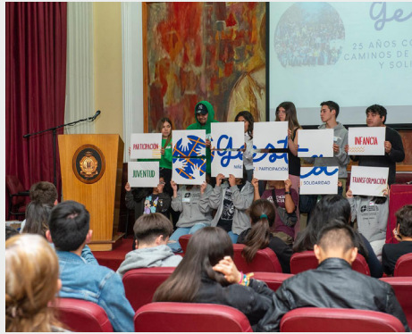
CHILE: 25 AÑOS DE LA FUNDACIÓN GESTA PARA LA SOLIDARIDAD MARISTA