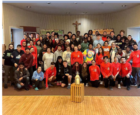
ESTADOS UNIDOS: ENCUENTRO DE ESCUELAS MARISTAS