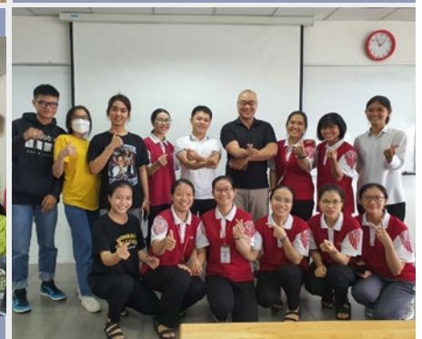
VIETNAM: CURSO DE INGLÉS EN HONG BANG UNIVERSITY

en el este de Sepik. Ellos también abrieron comunidades en Goroka, Port Moresby y Madang. Los maristas también se aventuraron más allá de sus bastiones hacia Enga y las Provincias Occidentales.