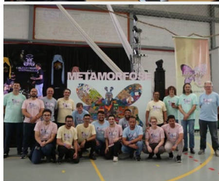
BRASIL: HERMANOS MARISTAS EN EL ENCUENTRO DE JÓVENES DE BRASIL SUL AMAZÔNIA