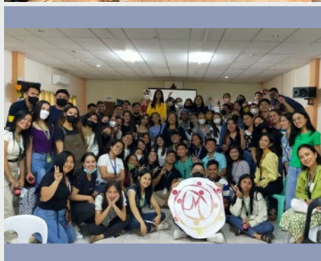
FILIPINAS: FORMACIÓN PARA ESTUDIANTES DE NOTRE DAME OF DADIANGAS UNIVERSITY