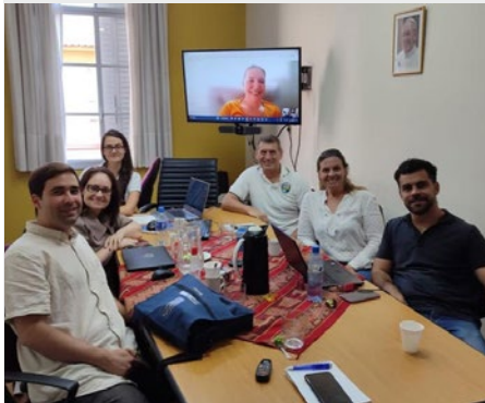
ARGENTINA: ENCUENTRO DEL EQUIPO DE COMUNICACIONES DE LA REGIÓN MARISTA AMÉRICA SUR