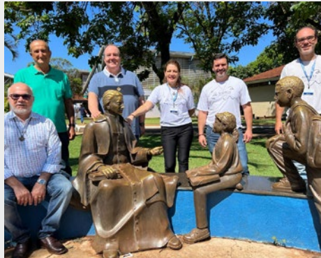
BRASIL: ESCOLA SOCIAL MARISTA IRMÃO RUI – RIBEIRÃO PRETO