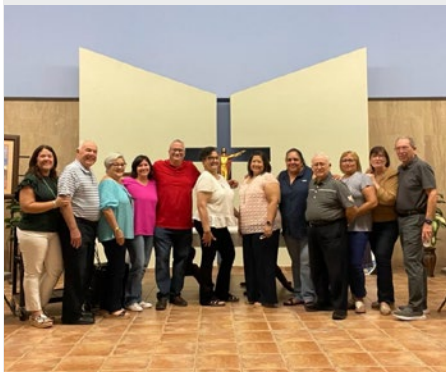
PUERTO RICO. GRUPO DE LAICOS GIER