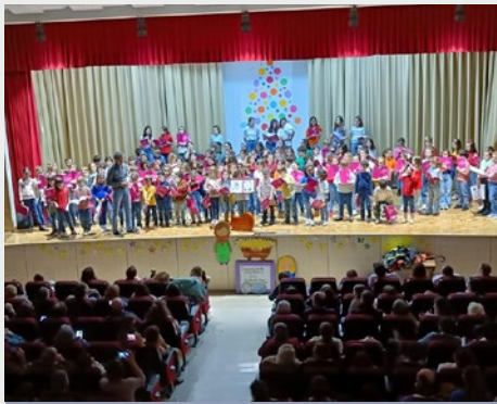
ESPAÑA: COLEGIO CHAMBERÍ – CONCIERTO DE ADVIENTO