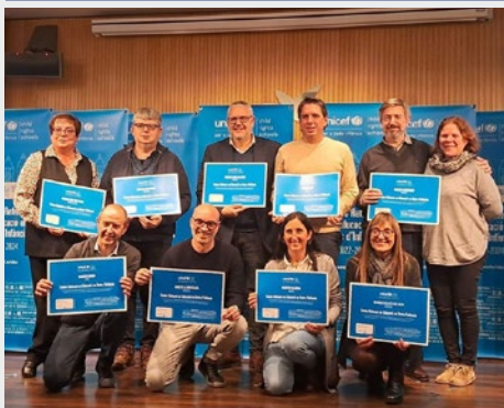
ESPAÑA: ESCUELAS MARISTAS DE CATALUNYA SON CENTROS DE REFERENCIA EN DERECHOS DE LA INFANCIA