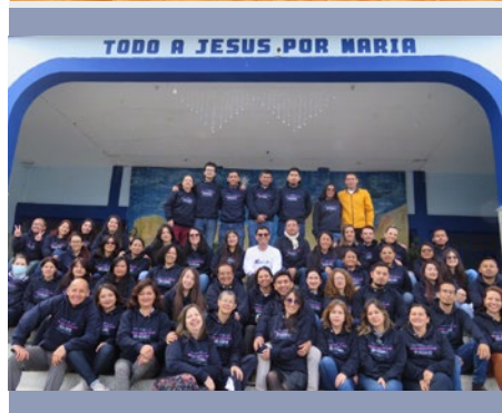
COLOMBIA: COLABORADORES MARISTAS DEL ÁMBITO DE EVANGELIZACIÓN – PASTO