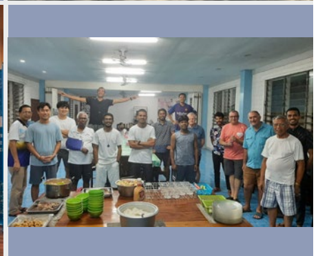
FILIPINAS: NOVICIADO DE TAMONTAKA