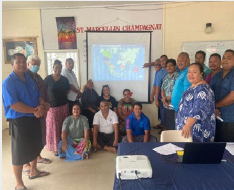
SAMOA: PERSONAL DEL ST JOSEPH'S COLLEGE, ALAFUA, SAMOA