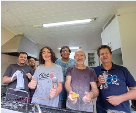
BRASIL: COMUNIDAD DEL COLÉGIO PARANAENSE, CURITIBA