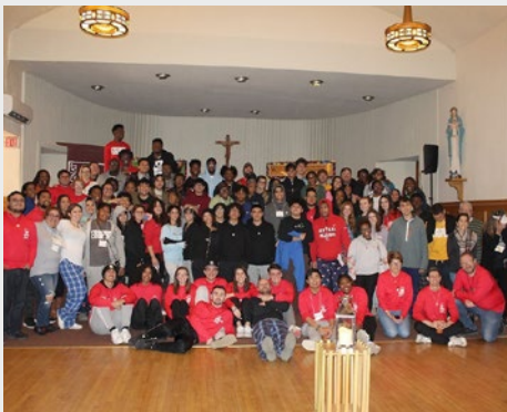
ESTADOS UNIDOS: PRIMER ENCUENTRO ANUAL JUVENIL DE COLEGIOS MARISTAS.