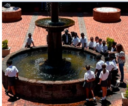
SUDÁFRICA: SACRED HEART COLLEGE JOHANNESBURG