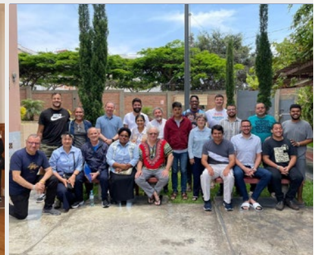
PERÚ: ENCUENTRO DE HERMANOS POST-NOVICIOS DE LA REGIÓN AMÉRICA SUR

Padres Oblatos, existe una gran oportunidad para el trabajo apostólico entre un número incontable de los hijos de Dios, en una tierra que casi parece haber sido olvidada”.