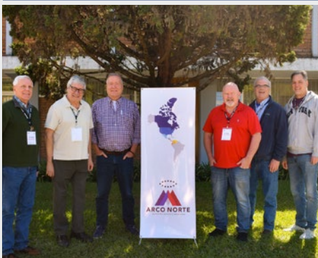
GUATEMALA: SUPERIORES DE LAS UNIDADES ADMINISTRATIVAS DE LA REGIÓN ARCO NORTE