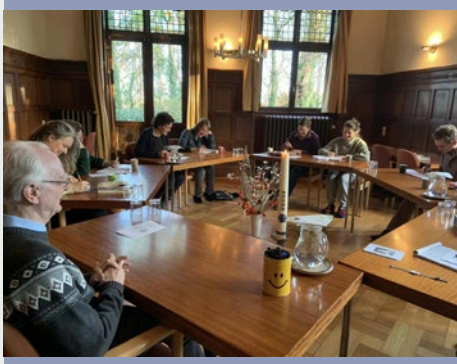
PAÍSES BAJOS: INAUGURACIÓN DEL PROGRAMA «NUEVOS COMIENZOS» EN LEERHUIS WESTERHELLING