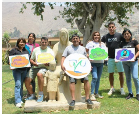
PERÚ: RETIRO DEL CONSEJO DIRECTIVO DE LOS COLEGIOS MARISTAS EN LIMA