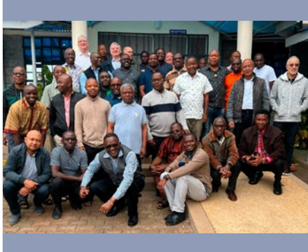
KENIA: ASAMBLEA REGIONAL DE CONSEJOS PROVINCIALES, NAIROBI