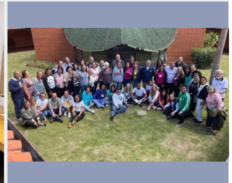
VENEZUELA: ASAMBLEA NACIONAL DE LAICADO MARISTA