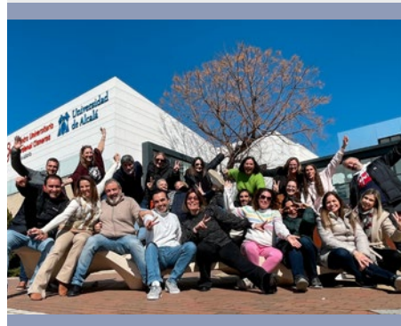
ESPAÑA: PROVINCIA IBÉRICA – ACCIÓN FORMATIVA MARCELINO 3.0