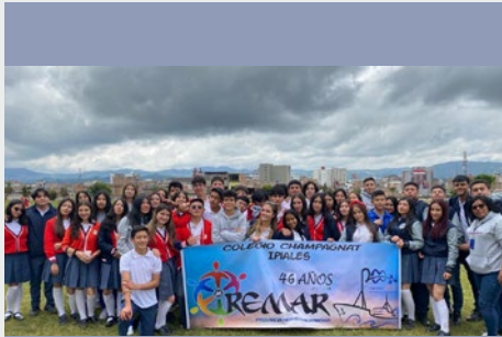
COLOMBIA: CELEBRACIÓN DEL ANIVERSARIO DEL MOVIMIENTO REMAR