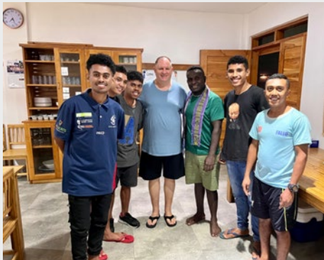
TIMOR ORIENTAL: FORMACIÓN DEL POSTULANTADO EN LA CASA MARISTA TEULALE