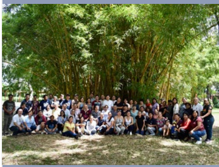
BOLIVIA: ENCUENTRO DE EQUIPOS DIRECTIVOS Y DE EQUIPOS DE ANIMACIÓN MARISTAS