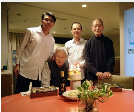
JAPÓN: COMUNIDAD MARISTA DE KOBE