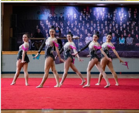
CHILE: FESTIVAL DE GIMNASIA RÍTMICA COLEGIO MARISTA SANTIAGO