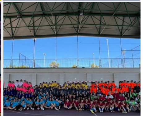
ESPAÑA: JORNADA DEPORTIVA PROVINCIAL EN LA RIOJA