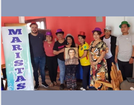
ECUADOR: ENCUENTRO NACIONAL DE EVANGELIZACIÓN