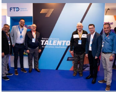
BRASIL: X ENCUENTRO CONFESIONAL INTEGRAL DE FTD EDUCACÃO