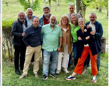
ESPAÑA: EQUIPOS DE FORMACIÓN DE NUEVOS EDUCADORES E IDENTIDAD MARISTA