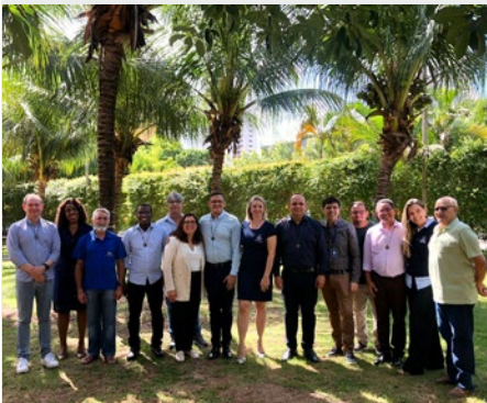
BRASIL: CONSEJO PROVINCIAL DE BRASIL CENTRO-NORTE EN NATAL