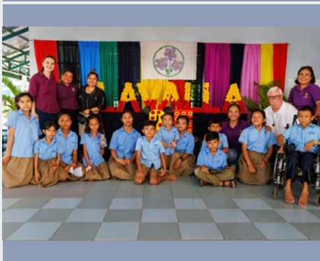
CAMBOYA: 25 ANIVERSARIO DE LA ESCUELA LAVALLA EN KANDAL