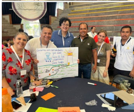
MÉXICO: PRIMERA ASAMBLEA PROVINCIAL EN CIUDAD DE MÉXICO