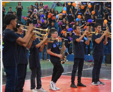
EL SALVADO: 100 AÑOS DE PRESENCIA MARISTA EN AMÉRICA CENTRAL