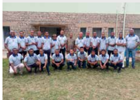
MADAGASCAR: APERTURA DEL POSTULANTADO EN AMPAHIDRANO FIANARANTSOA