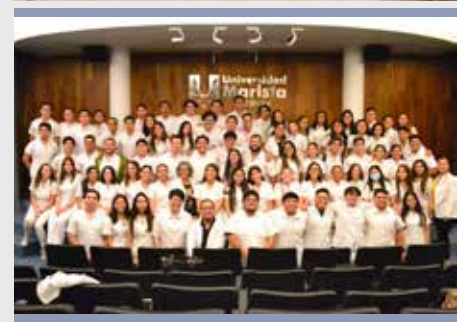
MÉXICO: XII SIMPOSIO DE INVESTIGACIÓN: GENÉTICA MÉDICA, UNIVERSIDAD MARISTA DE MÉRIDA.