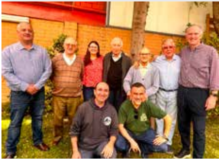
CHILE: REUNIÓN SECRETARIADO DE LAICOS