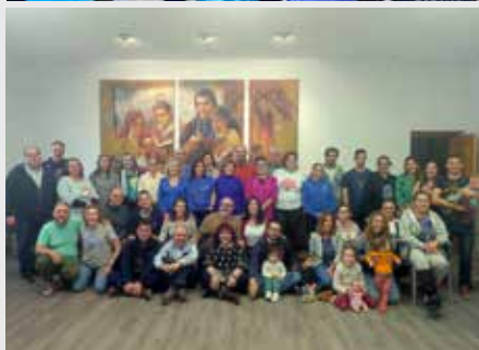
ESPAÑA: PARTICIPANTES DEL ITINERARIO VIDA MARISTA DE COMPOSTELA