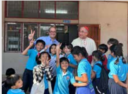
TAILANDIA: PRIMER VISITA DEL CARDENAL DE BANGKOK AL NUEVO CENTRO DE APRENDIZAJE MARISTA