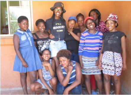
SUDÁFRICA: PROGRAMAS DE LIDERAZGO JUVENIL EN MARIST MERCY CARE