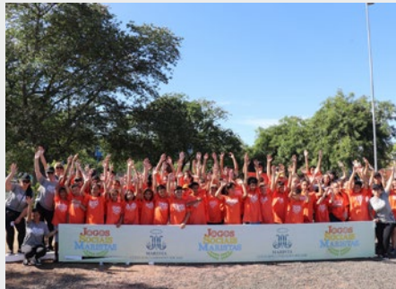
BRASIL: JUEGOS SOCIALES MARISTAS