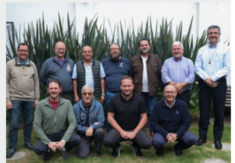
COLOMBIA: ENCUENTRO DE ESTRUCTURAS JURÍDICAS EN BOGOTÁ