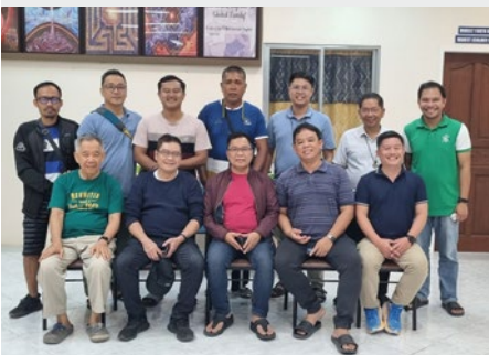
FILIPINAS: LÍDERES COMUNITARIOS DEL SECTOR DE LOS HERMANOS MARISTAS DE FILIPINAS