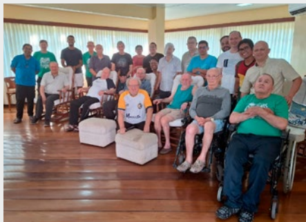
BRASIL: HERMANOS DEL POSTNOVIADO VISITAN A HERMANOS MAYORES EN VIAMÃO