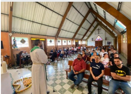
COLOMBIA: RETIRO ESPIRITUAL "GENERAR VIDA MARISTA" EN BOGOTÁ