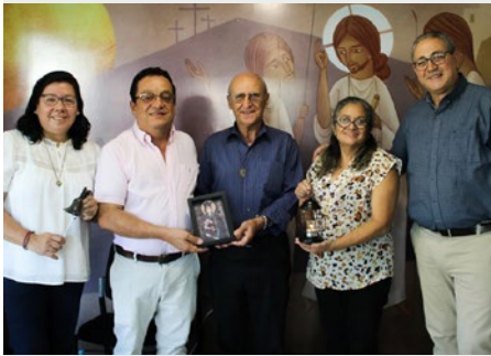
EL SALVADOR: NUEVA COMUNIDAD MIXTA H. LORENZO, EN SACACOYO