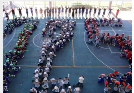
MÉXICO CENTRAL: CÉLÉBRATION DE 125 ANS DE PRÉSENCE MARISTE AU MEXIQUE