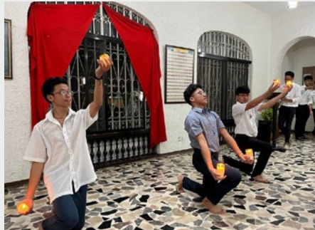
FILIPINAS: CELEBRACIÓN DEL FESTIVAL SINULOG