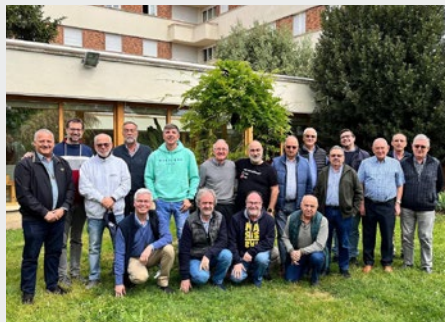
ESPAÑA: ENCUENTRO DE ANIMADORES COMUNITARIOS DE IBÉRICA