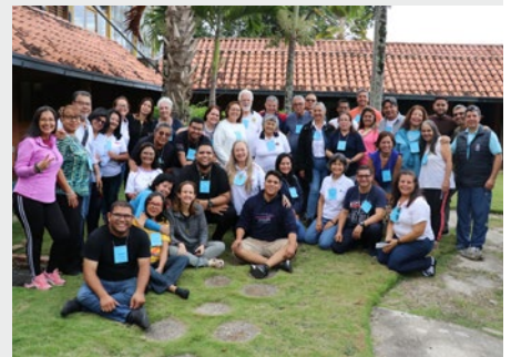
VENEZUELA: ASAMBLEA NACIONAL DEL LAICADO MARISTA