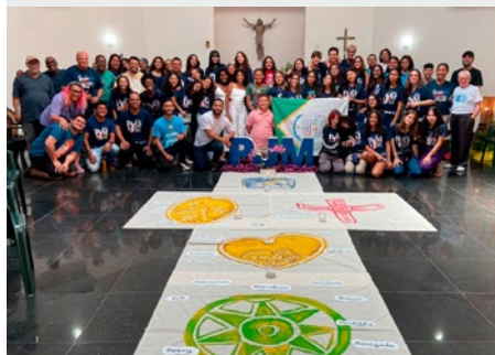
BRASIL: PASTORAL JUVENIL MARISTA BRASIL CENTRO-SUL