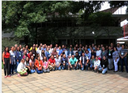
MÉXICO: ENCUENTRO B-LEARNING MARISTA EN GUADALAJARA