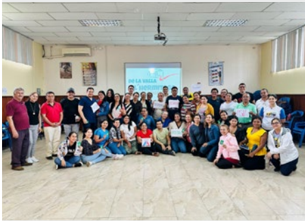
ECUADOR: TALLER DE LA VALLA A L'HERMITAGE CON 270 DOCENTES