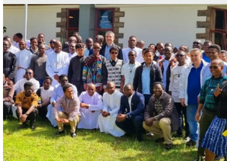
KENIA: MARIST INTERNATIONAL CENTER (MIC), NAIROBI