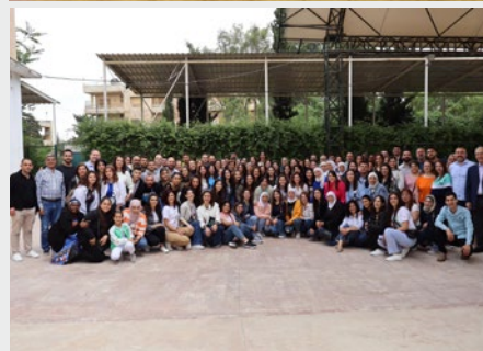
SIRIA: CELEBRACIÓN DEL DÍA DE LOS MARISTAS AZULES DE ALEPO EL 6 DE MAYO