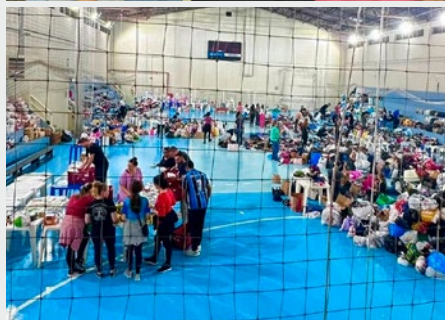
BRASIL: SOLIDARIDAD EN EL COLÉGIO MARISTA ROSÁRIO CON LOS DESALOJADOS POR INTENSAS LLUVIAS