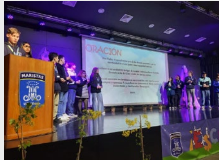
CHILE: ENCUENTRO DE CENTROS DE ESTUDIANTES MARISTAS 2024