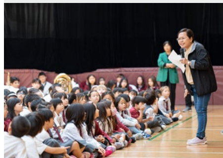
JAPÓN: ESCUELA INTERNACIONAL MARISTA, KOBE