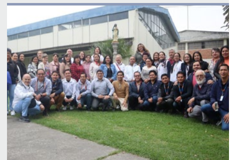
ECUADOR: ENCUENTRO DE DIRECTIVOS DE LAS INSTITUCIONES EDUCATIVAS MARISTAS