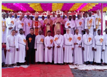
INDIA: CELEBRACIÓN DE 50 AÑOS DE PRESENCIA