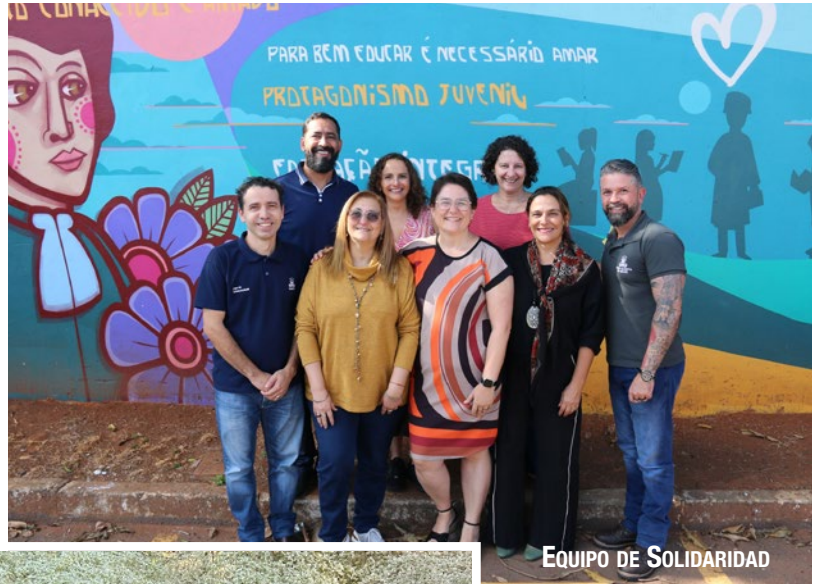
EQUIPO DE SOLIDARIDAD

Por otro lado, el Equipo de Solidaridad de la Región América Sur presentó, durante su encuentro, la agenda de las actividades previstas, con el objetivo de articular proyectos y