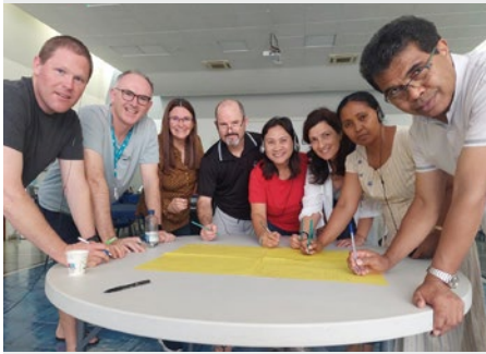
CASA GENERAL: SECRETARIADO AMPLIADO DE LAICOS