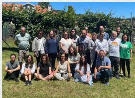
ESPAÑA: ENCUENTRO DE FORMACIÓN SOBRE INTERIORIDAD EN COMPOSTELA