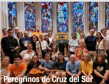
Peregrinos de Cruz del Sur

Grupos de las provincias de Compostela y Cruz del Sur visitaron los lugares maristas en Francia las dos primeras semanas del mes. El grupo Compostela peregrinó del 4 al 10 de julio. Mientras, algunos miembros de la Provincia Cruz del Sur estuvieron hasta el 15 de julio en los lugares donde se originó el Instituto.