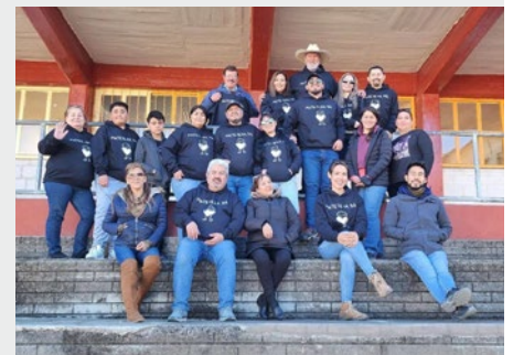
MÉXICO: MISIONEROS MARISTAS EN LA SIERRA TARAHUMARA

márgenes peligrosos o incluso peor. ¿No serían estos los que más necesitan manifestaciones de solidaridad?