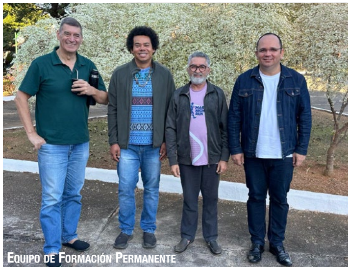
EQUIPO DE FORMACIÓN PERMANENTE

acciones estratégicas en el campo de la solidaridad, teniendo en cuenta las realidades emergentes. Cada Provincia presentó su diagnóstico en relación a las acciones e iniciativas de Solidaridad, con el objetivo de analizar los puntos comunes y los desafíos que necesitan ser identificados, alineándolos con las prioridades recientemente definidas en la III Asamblea Internacional