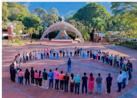
COLOMBIA: TALLER DE LA VALLA A L'HERMITAGE