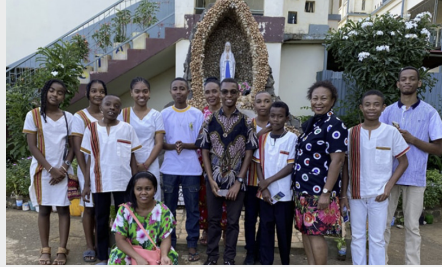
MADAGASCAR: JÓVENES MARISTAS EN DIEGO SUAREZ