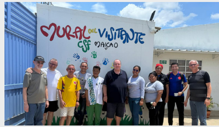
CONSEJO DEL PROYECTO FRATELLI VISITA MAICAO, COLOMBIA