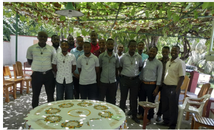
HAITÍ: RENOVACIÓN DE LOS VOTOS RELIGIOSOS DE JÓVENES HERMANOS