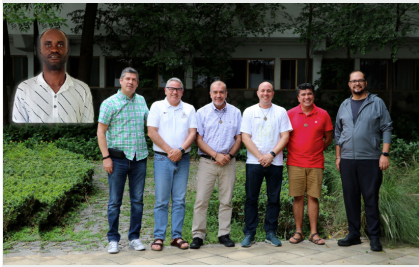
NUEVO CONSEJO PROVINCIAL DE MÉXICO OCCIDENTAL