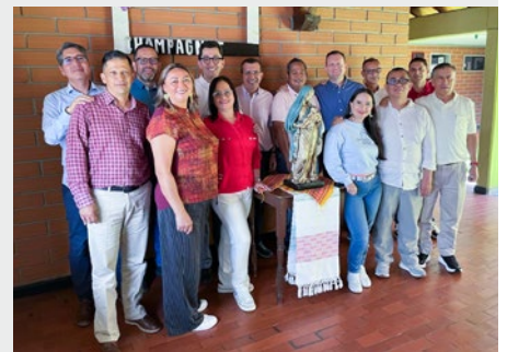
NORANDINA: LOS RECTORES DE LOS COLEGIOS MARISTAS DE COLOMBIA REUNIDOS EN MEDELLÍN

comenzó con el trabajo de revisión y discusión de las normas sobre la dinámica de misión y vida de los hermanos, seguido de una votación para elegir las normas que serán implementadas.