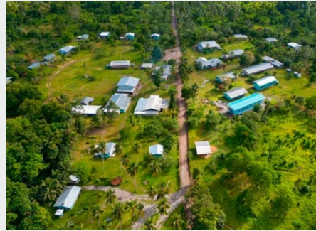
PAPÚA-NEUA GUINEA: EL ST JOSEPH'S COLLEGE DE MABIRI FINALIZA PROYECTO DE CONSTRUCCIÓN