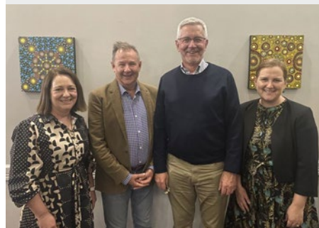
CONFERENCIA BIENAL DE LAS ESCUELAS MARISTAS DE AUSTRALIA 2024