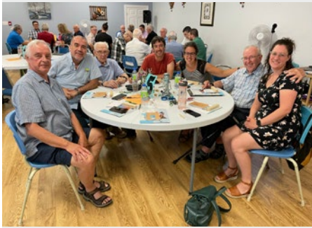
CANADÁ: ASAMBLEA DE DISTRITO