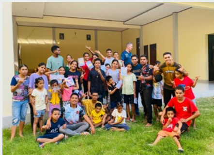
TIMOR ORIENTAL: JORNADA PASTORAL DE POSTULANTES MARISTAS EN LA PRÉ-ESCOLA SINT MARIE, DILI