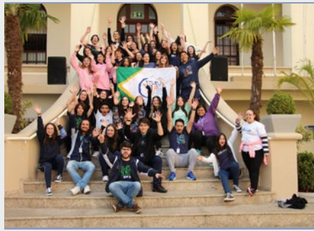
BRASIL: 19º ANIVERSARIO DE LA PASTORAL JUVENIL MARISTA