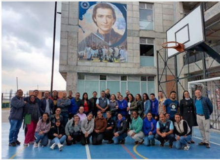
COLOMBIA: TALLER PARA DOCENTES “DE LA VALLA A L’HERMITAGE” EN BOGOTÁ