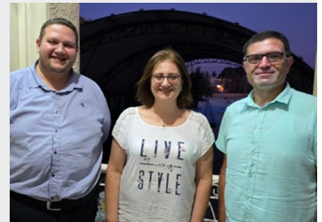
SIRIA: NUEVO EQUIPO DE ADMINISTRACIÓN DE LOS MARISTAS AZULES