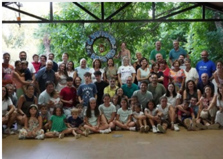
LÍBANO: RETIRO ESPIRITUAL DE LA PROVINCIA MEDITERRÁNEA