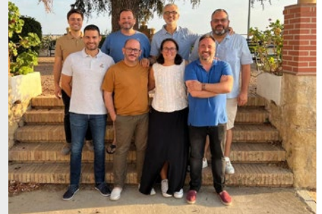
MEDITERRÁNEA: CONSEJO DE MISIÓN DE MARISTAS