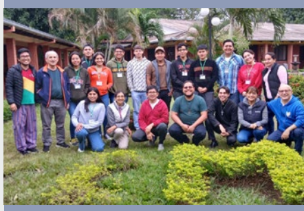
BOLIVIA: RETIRO DE JÓVENES MARISTAS EN SANTA CRUZ