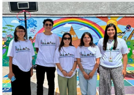
MÉXICO: CENTRO DE APOYO MARISTA AL MIGRANTE