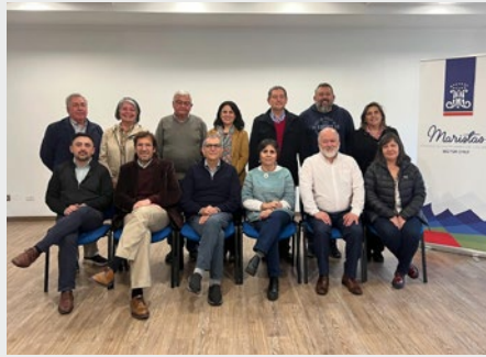
CHILE: SESIÓN DEL CONSEJO DE VIDA Y MISIÓN