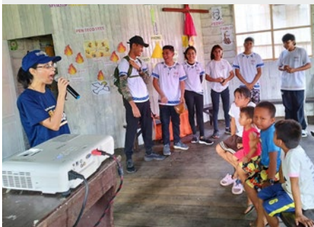
BRASIL: MISIONEROS MARISTAS EN TRIPLE FRONTERA AMAZÓNICA