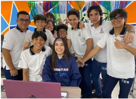
MÉXICO: ALUMNOS DE SINALOA Y BOGOTÁ EN EL PROGRAMA DE LA RED GLOBAL DE ESCUELAS