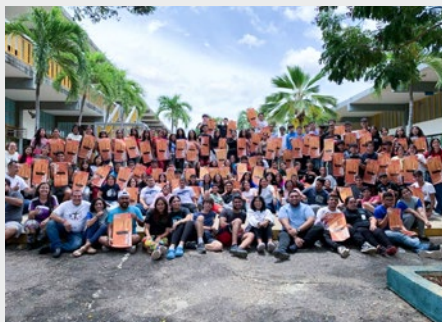
VENEZUELA: FORMACIÓN DE JÓVENES MARISTAS DEL MOVIMIENTO REMAR