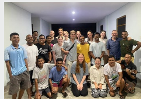
TIMOR ORIENTAL: ENCUENTRO DE LA COMUNIDAD MARISTA DE BAUCAU CON ASSUMPTION COLLEGE KILMORE