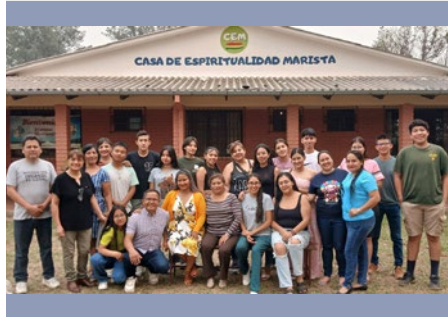
BOLIVIA: ENCUENTRO DE VOLUNTARIOS MARISTAS