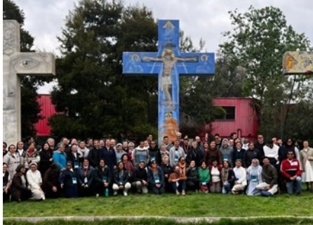
CHILE: SEMINARIO “COMUNIDADES VOCACIONALES” EN SANTIAGO