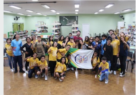
BRASIL: ENCUENTRO DE EQUIPOS DE LA PASTORAL JUVENIL MARISTA DE BRASIL CENTRO-SUL