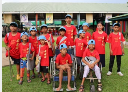
CAMBOYA: CAMPAMENTO ANUAL LAVALLA