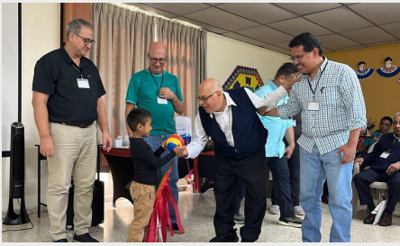
AMÉRICA CENTRAL: ENCUENTRO PROVINCIAL DE FRATERNIDADES