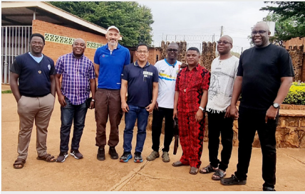
MALAUÍ: ENCUENTRO DELLA COMISIÓN AFRICANA DE MISIÓN