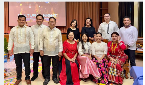
TAILANDIA: ENCUENTRO CULTURAL DE HERMANOS Y LAICOS MARISTAS