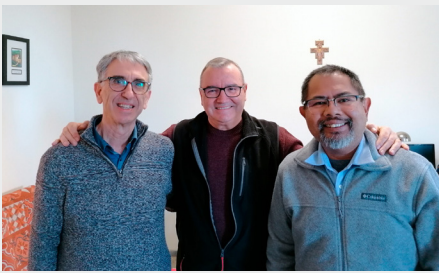
CASA GENERAL: SECRETARIADO HERMANOS HOY