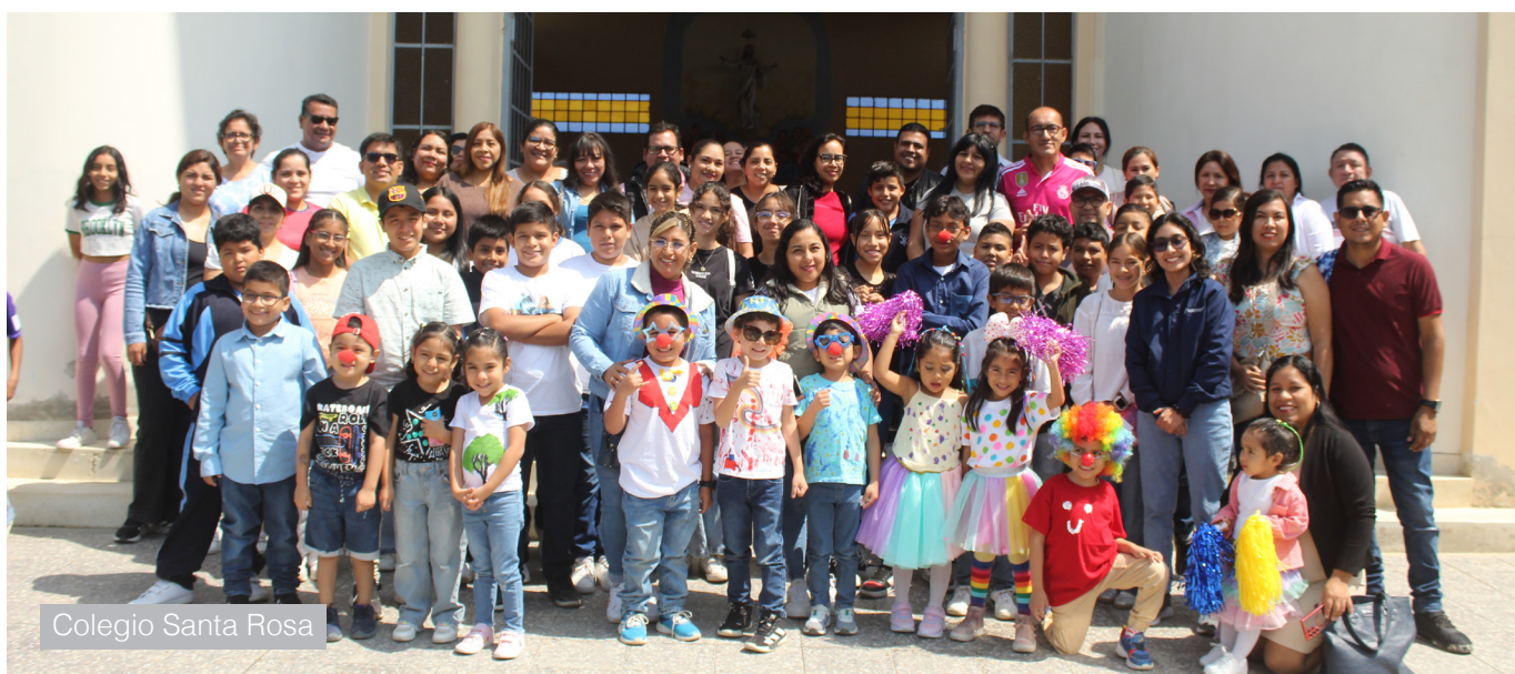
Colegio Santa Rosa

¿Y tú, estás listo para ser parte de este movimiento de solidaridad? La invitación está hecha. Ya sea donando tu tiempo, tus habilidades o tus recursos, hay innumerables formas de hacer una diferencia. Cada gesto, por pequeño que parezca, tiene el poder de cambiar una vida.