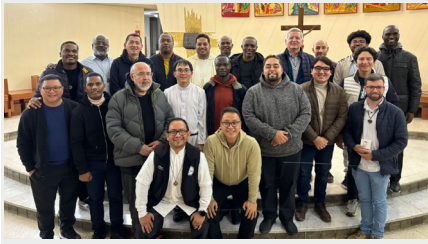
PROGRAMA DE FORMACIÓN NUEVOS CONSTRUCTORES DEL HERMITAGE