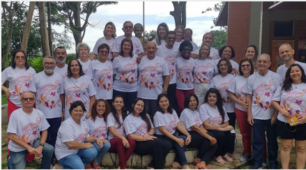
BRASIL CENTRO-NORTE: ASAMBLEA PROVINCIAL DEL MCFM