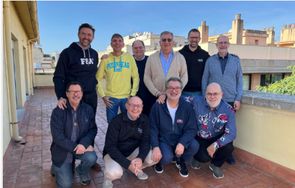
ESPAÑA: REUNIÓN DEL CONSEJO REGIONAL DE EUROPA