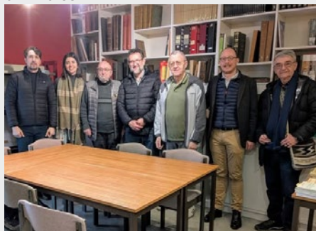
FRANCIA: EL CENTRO DE ARCHIVO MARISTA RECIBE AL EQUIPO DEL MEMORIAL MARISTA DE BRASIL CENTRO-SUL