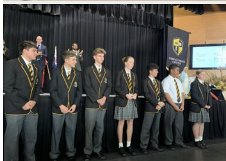
AUSTRALIA: CORPUS CHRISTI COLLEGE MAROUBRA, SYDNEY