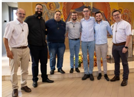
BRASIL: ASPIRANTES DE LA PROVINCIA DE BRASIL CENTRO-SUL