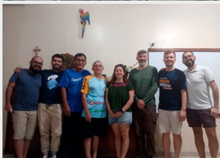
BRASIL: COMUNIDADES MARISTA Y DE LA SALLE EN TABATINGA