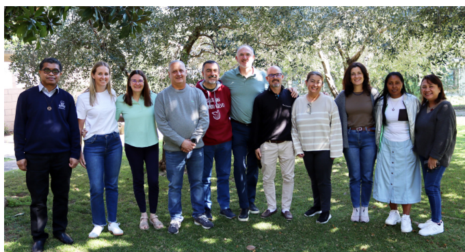
Secretariado Ampliado de Laicos