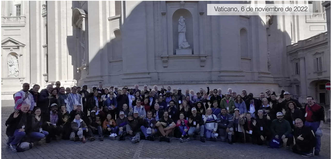
Vaticano, 6 de noviembre de 2022