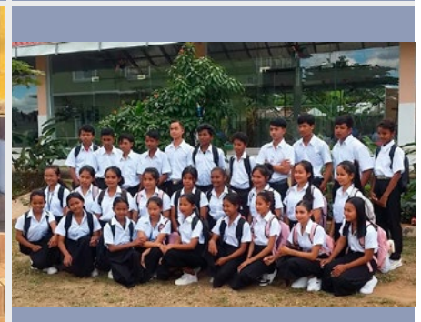
CAMBOYA: MARIST CENTER OF HOPE, PAILIN