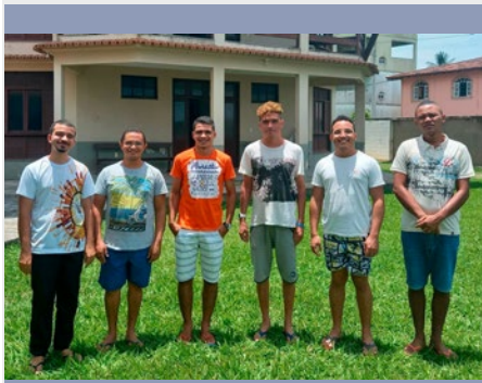
BRASIL: PRE-POSTULANTADO DE VILA VELHA