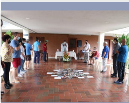
COLOMBIA: ASAMBLEA DE VIDA Y MISIÓN MARISTA – CALI