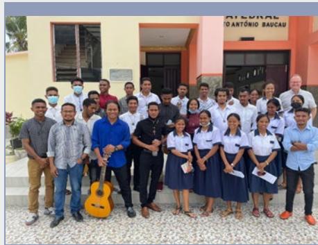
TIMOR ORIENTAL: IRMAUN MARISTAS