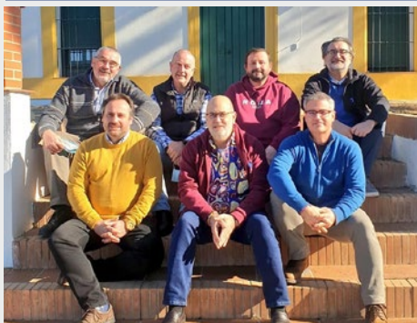
ESPAÑA: CONSEJO PROVINCIAL DE MEDITERRÁNEA