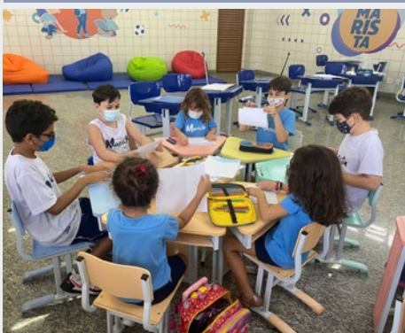
BRASIL: COLÉGIO MARISTA PALMAS