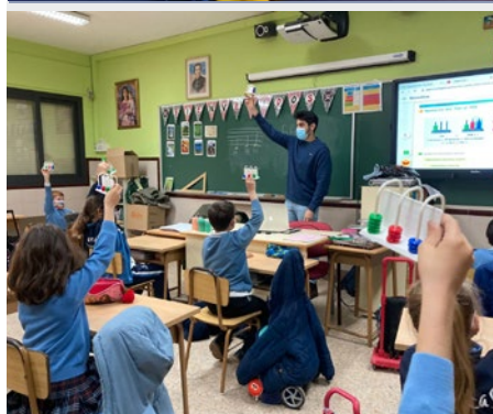
ESPAÑA: COLEGIO SANTA MARÍA MARISTAS, TOLEDO