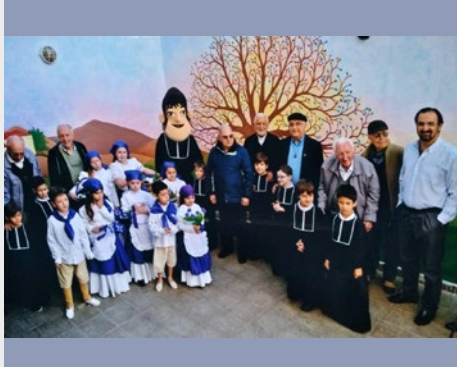
ARGENTINA: COLEGIO SAGRADO CORAZÓN: 95 AÑOS DE PRESENCIA MARISTA EN SAN FRANCISCO