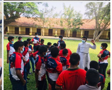
SRI LANKA: MARIST CHAMPAGNAT ASSOCIATION LEADERSHIP PROGRAM – NEGOMBO