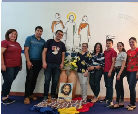
PARAGUAY: COMUNIDAD DE LAICOS MARISTA DE HORQUETA