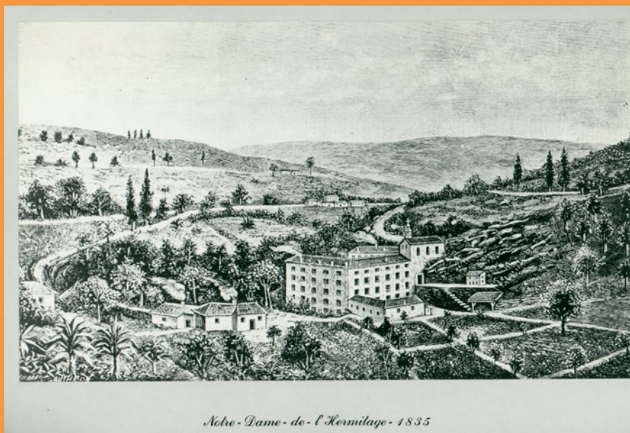
Nôtre-Dame-de-l'Hermitage - 1835