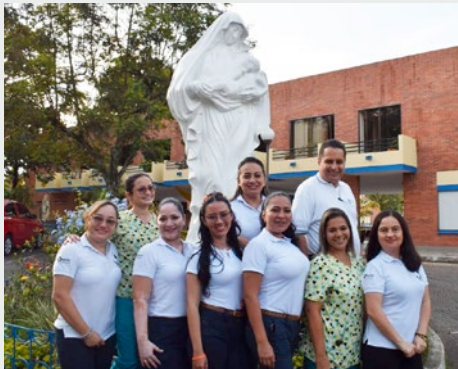
COLOMBIA: GRUPO DE LAICOS MARÍA FARO DE ESPERANZA, IBAGUÉ