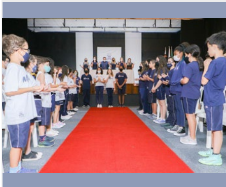
BRASIL: COLÉGIO MARISTA CHAMPAGNAT – TAGUATINGA