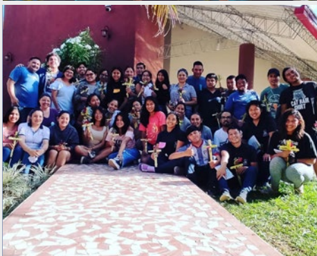
BOLIVIA: PASTORAL INFANTIL Y JUVENIL MARISTA