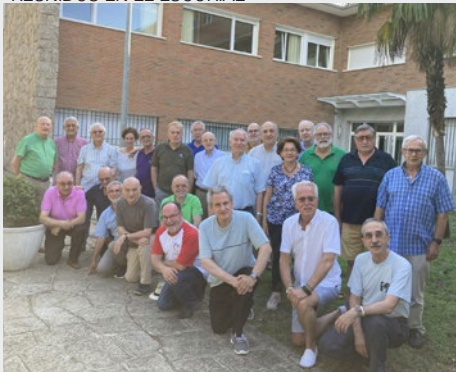
ESPAÑA: HERMANOS DE LAS PROVINCIAS DE COMPOSTELA, IBÉRICA Y MEDITERRÁNEA REUNIDOS EN EL ESCORIAL