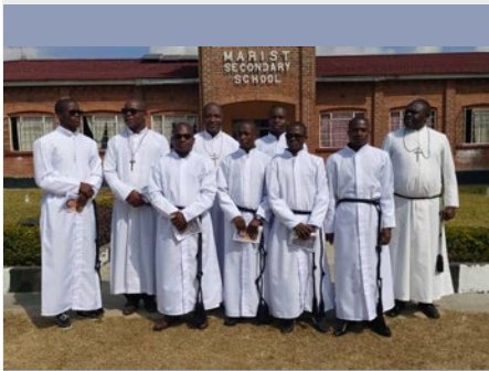
SUDÁFRICA: PRIMERAS PROFESIONES DE LA PROVINCIA DE ÁFRICA AUSTRAL