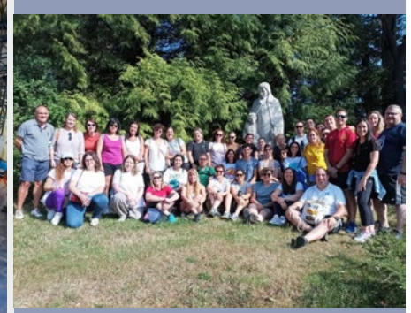
FRANCIA: HERMITAGE ESCUELA DE EDUCADORES DE COMPOSTELA EN LA VALLA