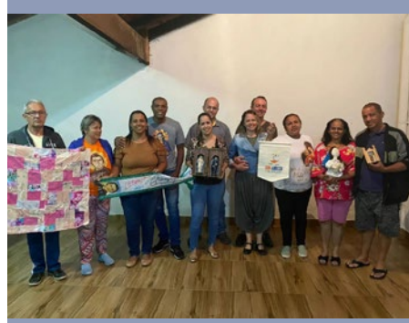
BRASIL: FRATERNIDAD DE SAN MARCELINO CHAMPAGNAT DE UBERLÂNDIA – (MG)