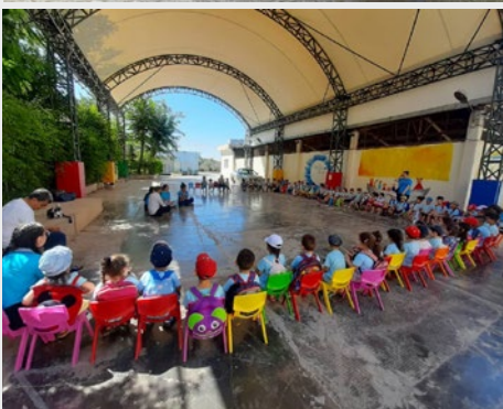
SIRIA: MARISTAS AZULES DE ALEPO