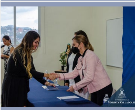
MÉXICO UNIVERSIDAD MARISTA VALLADOLID – MICHOACÁN, MORELIA