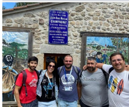
FRANCIA MARISTAS DE HUELVA VISITAN FOURVIÈRE