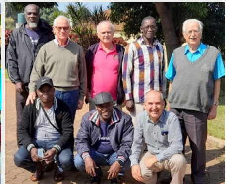
MOZAMBIQUE: RETIRO EN MATOLA SOBRE LA REGLA DE VIDA