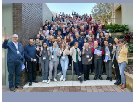
AUSTRALIA: ASAMBLEA DE LA ASOCIACIÓN MARISTA