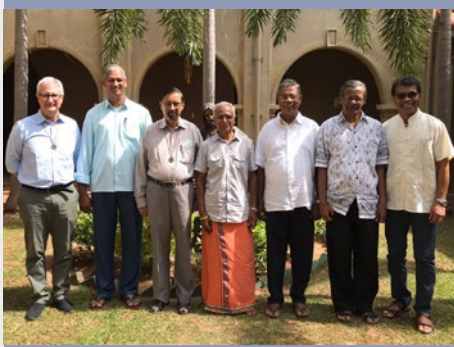
SRI LANKA: NUEVO CONSEJO DE LA PROVINCIA DE SOUTH ASIA, CON EL PROVINCIAL Y LOS CONSEJEROS GENERALES