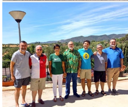
ESPAÑA: CONSEJO DE VIDA MARISTA DE LA PROVINCIA MEDITERRÁNEA