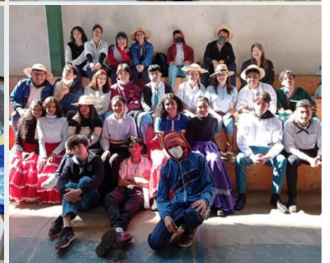
PARAGUAY: COLEGIO MARISTA CHAMPAGNAT DE CORONEL OVIEDO