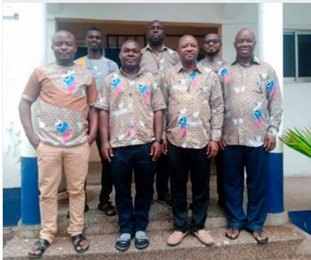
GHANA: COMUNIDAD DE LA CASA PROVINCIAL IN ACCRA