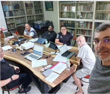
TAILANDIA: ENCUENTRO DEL CONSEJO DEL DISTRITO MARISTA DE ASIA