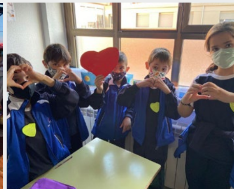
ESPAÑA: XVI PREMIOS A LA INNOVACIÓN EDUCATIVA COMPOSTELA – MARISTAS

La dificultad de comunicación por no conocer la lengua árabe es algo evidente. Sin embargo, los voluntarios fueron capaces de superar esto y descubrir muchas otras formas de comunicación, estando con la gente sin la intención de desarrollar grandes actividades.