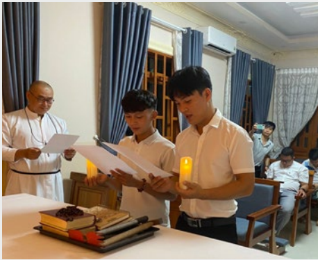
VIETNAM: CU CHI: DOS NUEVOS ASPIRANTES