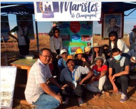
MADAGASCAR: ENCUENTRO NACIONAL DE LA JUVENTUD